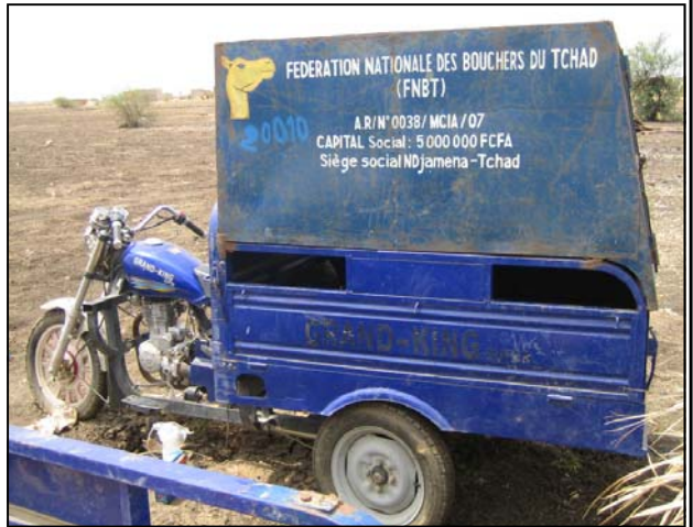
Tricycle motorisé aménagé pour le transport des car-

Ce service aux bouchers mis en place servira exclusivement pour le transport de la viande. Il sera payant au prorata du poids de viande transportée pour chaque boucher, ce qui permettra d'assurer le bon fonctionnement du service et l'entretien du véhicule.