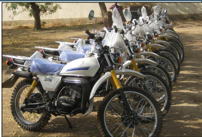
Vue de moto cross

La dotation de la DOPSSP en matériels vise à améliorer les capacités de ce service en matière d'appui aux Organisations Professionnelles. Les moyens rou-