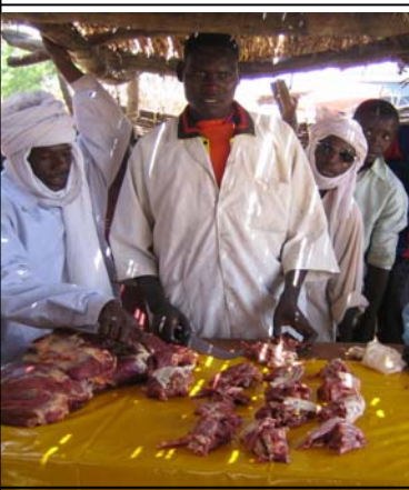
Étal de boucherie à Massakory

il s'agit d'aménagements couverts pour les kiosques ou seulement carrelés pour les étals améliorés offrant aux bouchers et aux transformatrices de viandes les conditions d'une commercialisation respectant les règles d'hygiène et de salubrité :