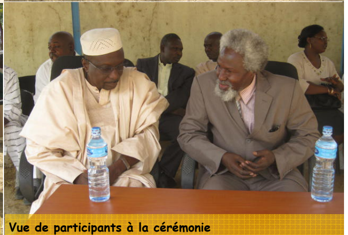
Vue de participants à la cérémonie