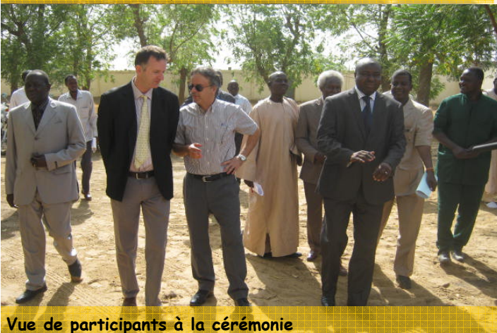
Vue de participants à la cérémonie