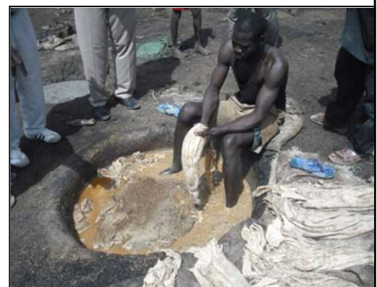
Vue tannerie de Diguel