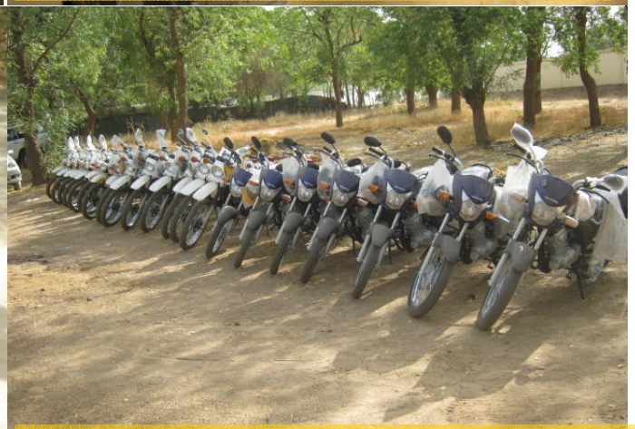
Vue des motos