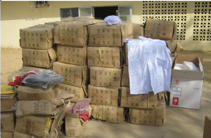
Blouses matériels d'inspection sanitaire